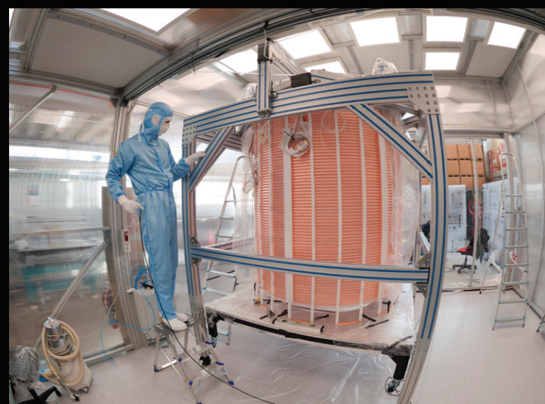
La camera a proiezione temporale (TPC) durante la fase di montaggio.

LA COLLABORAZIONE DEL PROGETTO XENON: 28 ISTITUZIONI E PIÙ DI 170 SCIENZIATI