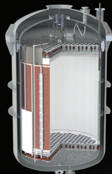
Rappresentazione 3D della TPC.

Inoltre, il rapporto dei due segnali permette di distinguere efficientemente eventi di fondo, dovuti a fotoni ed elettroni, da un possibile segnale di materia oscura che produrrebbe il "rinculo" di un nucleo di xenon.